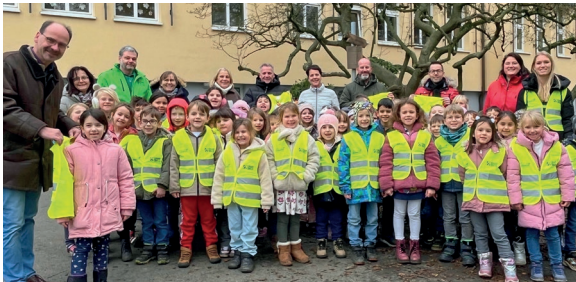
Diese Kinder nahmen für die insgesamt 271 Schulanfänger in Schwelm die Westen entgegen.

velsberg GmbH Internationale Spedition. Die Übergabe der Warnwesten fand an der Grundschule Nordstadt statt. Die Schulleitungen der vier Schwelmer Grundschulen nahmen die 271 Sicherheitswesten entgegen. Verkehrswach-