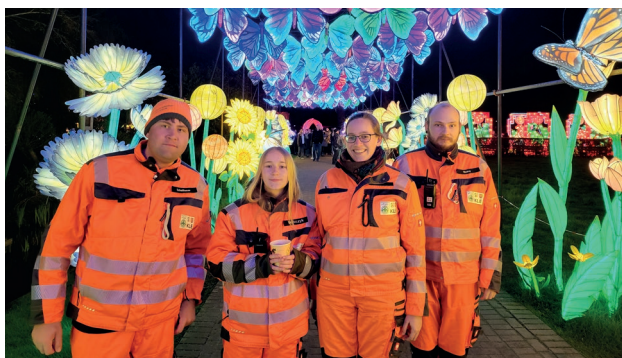
Dienst vor fantasievoller und leuchtender Kulisse: Die VK Kleve bei den China Lights.

Im Zeitraum vom 10. Oktober bis 29. November waren die Verkehrskadetten Kleve an 16 Tagen, immer freitags und samstags, bei den China Lights in Kleve im Einsatz. Sie sorgten für einen freien Rettungsweg, hielten zusätzliche Behindertenparkplätze frei und informierten die Besucher über Ausweichparkplätze.