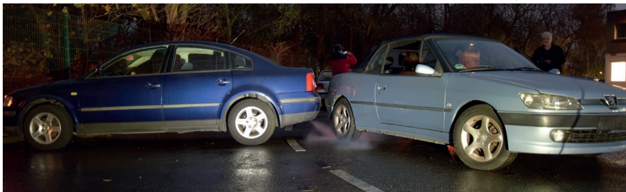
Schon im nüchternen Zustand waren die Aufgaben nicht leicht zu meistern, mit Alkohol im Blut wurde es fast unmöglich, ein Auto in einer solchen Situation nicht zu touchieren.

Für alle, die getrunken hatten, ging es nach einem erfahrungsreichen Abend übrigens mit dem Taxi nach Hause. Und alle, die nicht tranken, hatten mit Cannabisbrillen ebenso die Möglichkeit zu erfahren, wie ein Rauschzustand sich auf die Wahrnehmung auswirken kann und erahnen, was das für die Teilnahme am Straßenverkehr heißt.