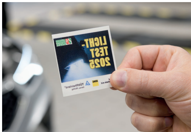
Präsidium und Vorstand sprachen darüber, wie es mit dem Licht-Test weitergehen soll.

Auf Zustimmung traf die Idee, den Parlamentarischen Abend nicht mehr in der bekannten Form durchzuführen, sondern wie 2023 einen Verkehrssicherheitstag im Landtag durchzuführen, zu dem die Parlamentarier dann eingeladen werden können. „Neben diesen erreichen wir so zusätzlich Besuchergruppen und Mitarbeiter“, so Vossemer. Eine weitere Entscheidung wurde getroffen: Da Präsidiumsmitglieder