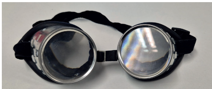
Solche Cannabisbrillen werden an die lokalen Verkehrswachen verteilt.

Als nächstes wurde SensiSmartRad, eine neue Anwendung der BASt, vorgestellt. Per Tablet fährt der Nutzer auf dem Fahrrad über eine Straße, die reale Umgebung wird mit eingebunden. Das Team der LVW hatte diese Fahrt, die einmal mit und einmal ohne Musik auf den Ohren stattfindet, aufgezeichnet und spielte diese vor. Neben der nicht ganz klaren Führung des Tablets und auch der Länge dieses etwas anderen Reaktionstests fiel das Wort „Geldver-