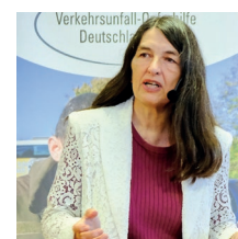
DVW-Präsidentin Lühmann moderierte.