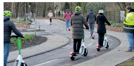
Die Schulung fand auf dem Gelände der Jugendverkehrsschule Dortmund statt.

Diese Fortbildung war der Start, es folgen weitere in Köln und Düsseldorf.