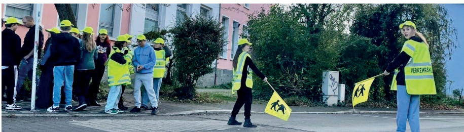
Einige der 60 neuen Schülerlotsen bei ihrer Ausbildung.