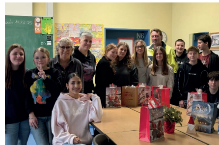
Verkehrswacht und Polizei haben sich bei den Schülerlotsen der Theodor-Heuss Realschule für ihr ehrenamtliches Engagement bedankt.

Kurz vor Weihnachten bedankten sich die VW Oberhausen und die Polizei bei den Schülerlotsen mit einer kleinen Weihnachtsüberraschung für ihren Einsatz. Die Schülerlotsen würden viele Unannehmlichkeiten - wie Regen und Wind sowie früheres Aufstehen - in Kauf nehmen, um für die Sicherheit von Grundschulern zu sorgen.