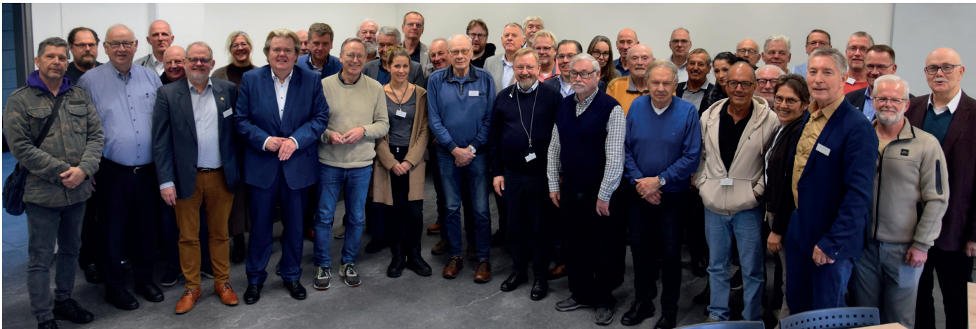
Die Geschäftsführer trafen in der Pause und dem darauffolgenden Vortrag noch auf die Präsidiums- und Vorstandsmitglieder, die im Anschluss tagten.