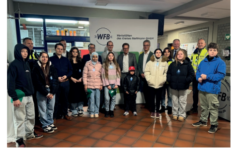
Schülerinnen und Schüler der Förderzentrum Nord und der Schule am Thekbusch freuten sich über die Blinkis, die die KVW Mettmann ihnen überreichte.

1.100 Blinkis und Kappen hat die KVW Mettmann an die WFB Werkstatt am Flandersbach, das Förderzentrum Nord und die Schule am Thekbusch verteilt. Stellvertretend für alle Schüler sowie alle Mitarbeiter nehmen zwei kleine Delegationen der Schulen zusammen mit ihren Schulleitungen die Blinkis und Kappen dankend entgegen. Unterstützt wurde die Aktion von der Firma Witte Automotive und deren Mitarbeiter sowie der DEKRA.