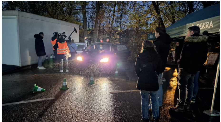
Von Medien begleitet konnten die Teilnehmer testen, wie sicher sie in einer sehr beengten Kurve fahren können. Die Pylone nicht umzufahren war Millimeterarbeit.

Bevor die Anwesenden der Aufforderung „Trinken Sie in kürzester Zeit so viel wie möglich!“ Folge leisteten, ging es nach draußen auf den Hinterhof des DEKRA-Gebäudes, in dem die Veranstaltung stattfand. Dort waren mit fünf Autos drei Rangier- und Parksituationen nachgestellt, denen sich die Teilnehmer stellen konnten. Noch nüchtern konnten viele die schwierigen Situationen meistern, hier und da fiel ein Pylon um oder zwei Autos streiften sich leicht. Zurück im Gebäude wurden dann Bier, Wein und Kurze ausgeschenkt. Auf einem Bierdeckel notierte jeder, was er getrunken hat. Die anwesenden Polizisten boten Atemalkoholtests an. In der Zeit