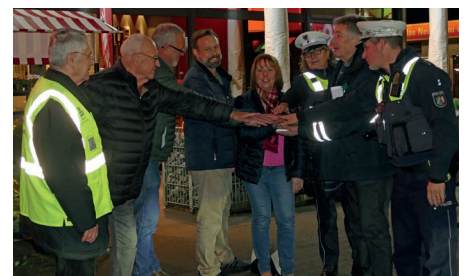
Die reflektierenden Elemente stechen aus dem Banner hervor (oben), aber es gibt auch weitere Botschaften ohne Reflexion, die bei Licht gut zu erkennen sind (Mitte). Alle Involvierten waren dabei, als das erste Mal auf den Lichtknopf gedrückt wurde.