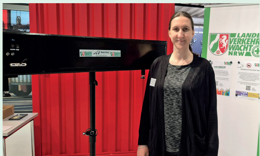
Der Prototyp der Dunkelbox wurde bei einigen Veranstaltungen vorgestellt - wie etwa bei der VEMB-Tagung.

Wer mit dem Thema Verkehrssicherheit zu tun hat, kennt die Zahlen: Wer im Dunkeln im Straßenverkehr unterwegs ist, ist im Scheinwerferlicht eines Fahrzeugs dunkel gekleidet auf etwa 25 Meter, hell gekleidet auf etwa 40 Meter und mit reflektierenden Sachen auf 120 Meter zu sehen. Damit diese Zahlen auch - besonders für Kinder - besser vorstellbar sind, hat die LVW gemeinsam mit bectec eine Dunkelbox entwickelt. In dieser befinden sich kleine Figürchen, die vom Nutzer selber vor- und zurückgefahren werden können. Der Aha-Effekt tritt für die Person, die in die Dunkelbox schaut, ein, wenn eine Person nach der anderen sichtbar wird. → Weiter auf Seite 3