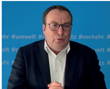
NRW-Verkehrsminister Oliver Krischer eröffnete den Tag.

Verkehrswacht aktuell | #1 | Januar 2026