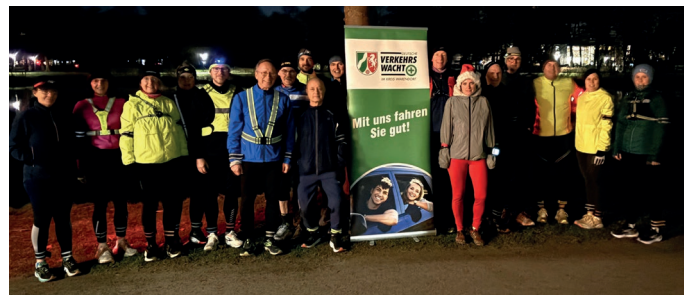
Die Laufgruppe der WSU Warendorf hat sich die Klettbänder zur besseren Sichtbarkeit an den Beinen befestigt.