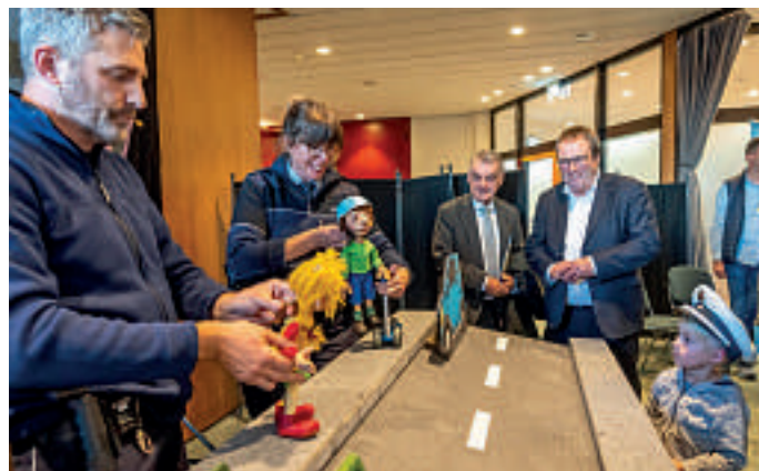
Um schon die Jüngsten für Verkehrssicherheit zu sensibilisieren, wird vielerorts ein Puppentheater eingesetzt. Die Minister Reul und Krischer zeigten sich angetan.

Die beiden Minister kamen mit Zeit im Gepäck und informierten sich an den Ständen über die Angebote. Im Rah-