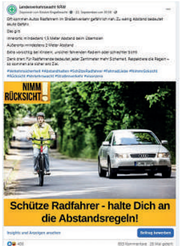
Dieser Post erreichte auch ohne Werbung eine große Reichweite.

Eine Frau mahnte gegenseitige Verantwortung an: „Radfahrer schützt euch im Straßenverkehr. Haltet euch an die StVO und kleidet euch situationsentsprechend. In der Dunkelheit empfiehlt sich helle, reflektierende Kleidung und Licht anmachen. Ihr fordert Rücksicht?“