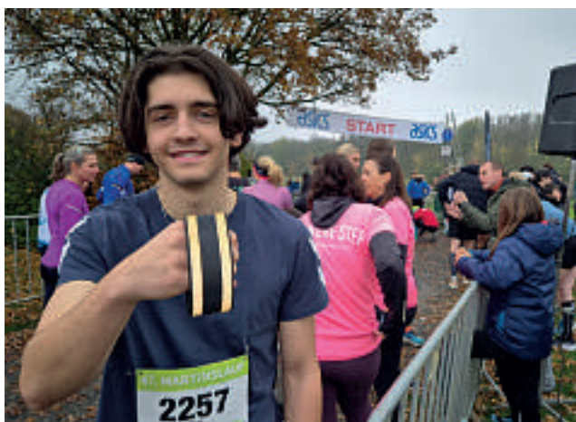
Beim Martinslauf in Düsseldorf wurden reflektierende Laufbänder an alle Teilnehmer ausgegeben.