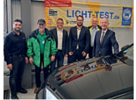
Unter anderem haben die Verkehrswachten in Olpe (oben) und Essen (unten) den diesjährigen Licht-Test unterstützt.