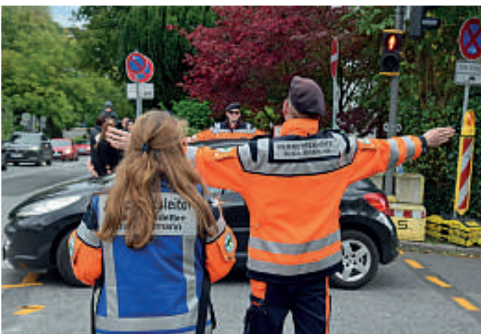
Auch Ampelübergänge wurden während der Kirmes wegen der komplett geänderten Verkehrsführung in Haan betreut.