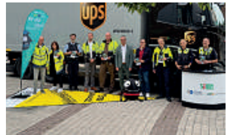
Eine Aktion zum Toten Winkel fand während des Wochenmarktes in Hochdahl statt.

Jeden Tag in Aktion war die KVV Mettmann gemeinsam mit der Straßenverkehrsbehörde des Kreises Mettmann und der Polizei im Rahmen der Mobilitätswoche im September. Ein Pedelec-Kurs, eine Fahrradhelm-Aktion auf dem Panoramaweg Heiligenhaus, eine Tote Winkel-Aktion und das Thema Sichtbarkeit in der Dunkelheit sowie Rollatorentaining – die Palette war bunt gemischt und griff viele Bereiche der Verkehrsprävention auf.