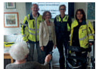
Das Rollatorentaining der KVV Mettmann kam bei den Teilnehmern ziemlich gut an.