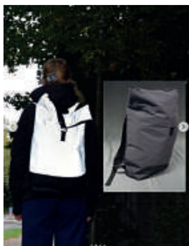
Angeschlossene Vereine der Sportjugend NRW verlosen an ihre jungen Mitglieder - wie hier die Radsportjugend.