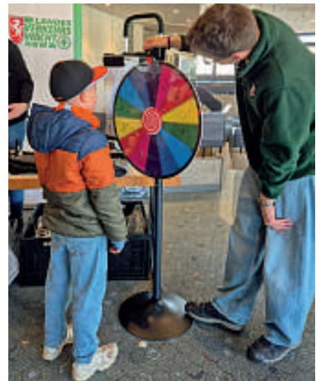
Wer am Glücksrad drehte, konnte reflektierende Sachen gewinnen.

Fußgänger kümmern“, so Reul. Er ging im Verlauf seiner Rede auch noch auf die Initiative #sicherimstraßenverkehr ein, die mit dieser Veranstaltung quasi ihren ersten Geburtstag feiere. Es sei ein großartiges Netzwerk entstanden, so Reul. „Prävention ist im Straßenverkehr das Wichtigste für Jung und