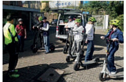
Das E-Scooter-Training fand auf dem Gelände der Jugendverkehrsschule statt.

Auf Initiative der ökumenischen Jugendarbeit Eicken e.V. mit Unterstützung der Verkehrssicherheitsberatung des Polizeipräsidiums und der VW Mönchengladbach fand das erste offizielle Fahrsicherheitstraining für E-Scooter statt. Auf dem Gelände der Jugendverkehrsschule konnten Interessierte zwischen 14 und 20 Jahren ihre Fahrsicherheit auf dem E-Scooter testen und verbessern. 16 Teilnehmer waren dabei. Vermittelt wurden theoretische Inhalte sowie Verkehrsregeln und Nutzungsvoraussetzungen für E-Scooter. Weiterhin wurde über das richtige und gegenseitig rücksichtsvolle Verhalten und die Gefahren im Straßenverkehr aufgeklärt. Im Anschluss ging es auf die Scooter und ein Parcours aus Hindernissen wie Schläuchen, Pylonen und einer Wippe wurde abgefahren. Auch wurden Bremsübungen durchgeführt. Alle Jugendlichen waren konzentriert bei der Sache und merkten von Runde zu Runde, dass sie sicherer wurden und es immer besser klappte. Die VW Mönchengladbach freut sich auf weitere solcher Trainings.