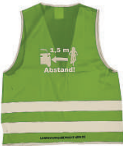
Die Abstandswesten befinden sich aktuell in der Verteilung.