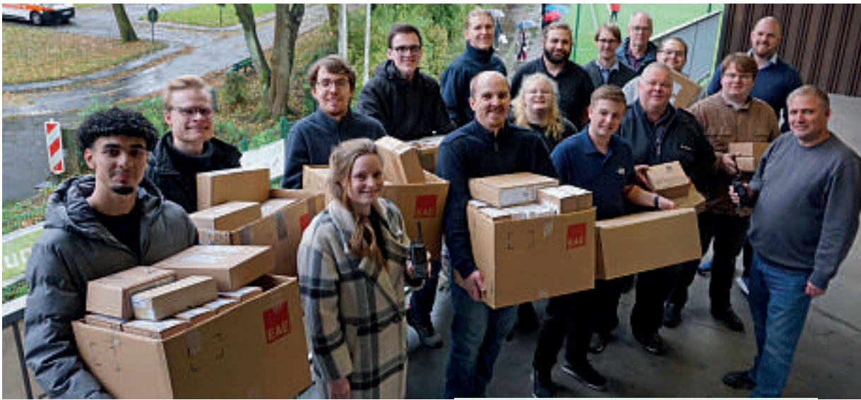
Mit Kartons voller Funkgeräte ging es für die Verkehrskadetten nach Hause.