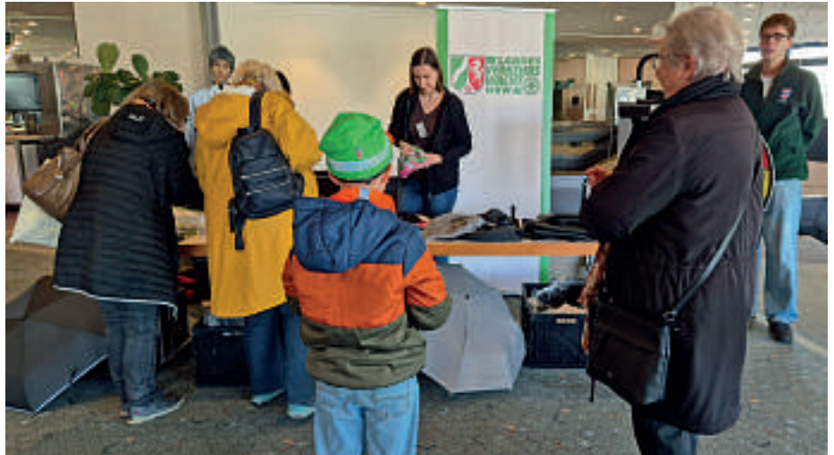
Am Stand der LVW konnten die Besucher sich über das Thema Sichtbarkeit im Straßenverkehr informieren und reflektierende Materialien gewinnen.

men eines kleinen Festaktes, bei dem auch neue Mitglieder in die Initiative aufgenommen wurden, machten beide darauf aufmerksam, wie wichtig Aufmerksamkeit, Sichtbarkeit und Rücksichtnahme im Verkehr sind.