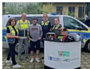
Im Rahmen des Pedelec-Trainings wurde darauf hingewiesen, wie wichtig Helmtragen ist.