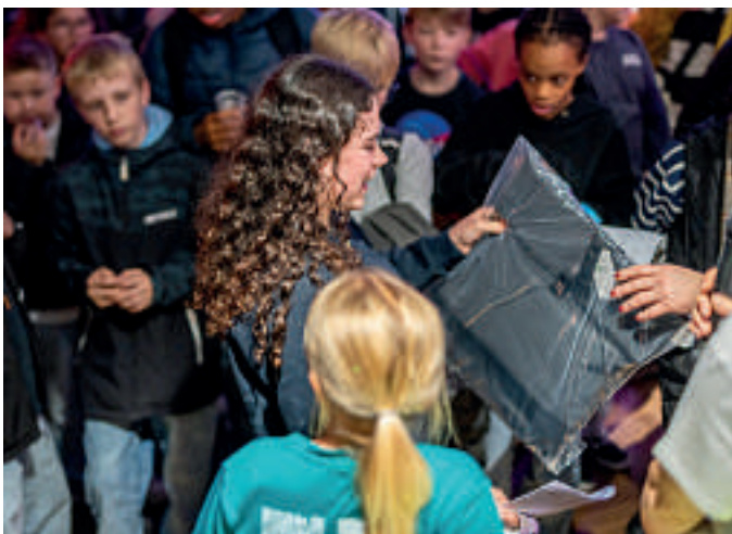
Bei der Forschernacht 4.0 in der Jugenduni Wuppertal wurden auch Materialien verteilt.