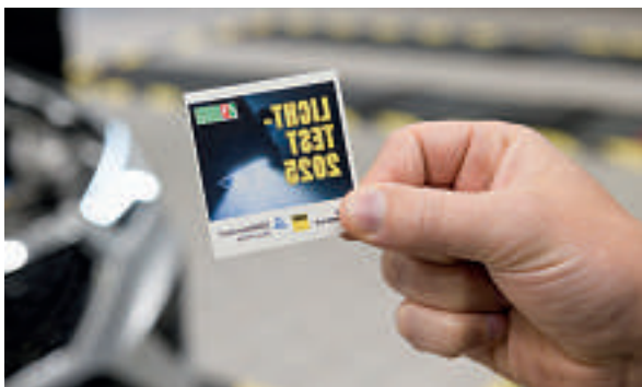
Bei funktionierender Beleuchtung können die Prüfer diese Plakette hinter die Windschutzscheibe des getesteten Fahrzeugs kleben.

Vertreter von ADAC und TÜV erklärten genau, wie der Licht-Test vorstattengeht. → Mehr zu lokalen Aktionen auf Seite 12